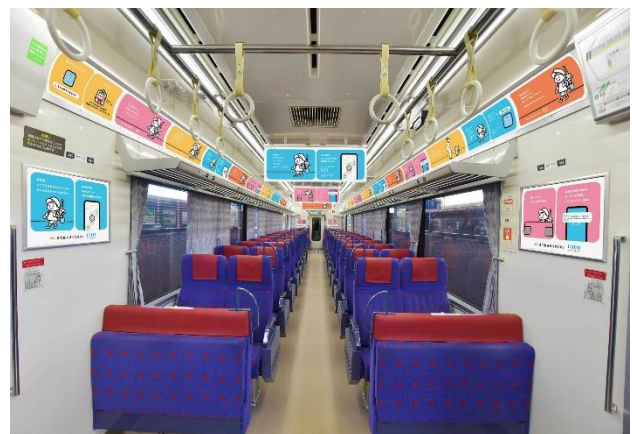
トレインジャック広告展開イメージ