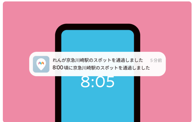
改札の通過をスマホにプッシュ通知

「みてねみまもり GPS トーク（京急線対応モデル）」公式サイト https://mitene.us/gps/kaisatsu