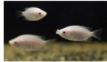
キッシンググラミー

展示内容：発達した唇を動かす動作がキスのように見えるキッシンググラミーを、花を使った綺麗な装飾とともに展示します。