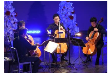
ペンギンと音楽の夜

すみだ水族館では10組以上のペンギンのカップルが、毎日決まった場所を自分たちの「おうち」として生活しています。「ペンギンライブ」では、個性豊かなペンギンたちの恋の話について解説します。