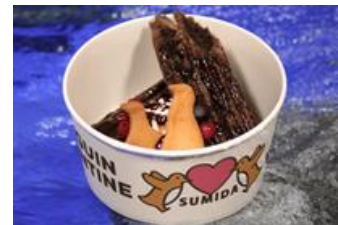
ペンギンチュリトス

販売内容：ココア味のチュリトスに、ホイップクリームとかわいいペンギン型のクッキーを乗せたスイーツメニューです。恋人と分け合って食べるのに最適です。