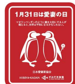
愛妻の日特製ステッカー

開催日：2015年1月31日（土） 配布時間：9時00分～ 配布場所：5F チケット窓口 開催内容：当日入場されるお客さま先着5,000名さまにマゼランペンギンのカップルを描いた「愛妻の日特製ステッカー」をプレゼントします。