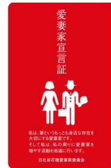
日比谷花壇特製 愛妻家宣言証