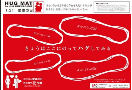
日本愛妻家協会×日比谷花壇 特製ハグマット

足型にあわせて夫婦で立っていただき、夫婦間のコミュニケーションを深めていただく簡易グッズ（紙製マット）です。「愛妻の日」1月31日の午後8時9分に、一斉にハグをしてみることもできます。