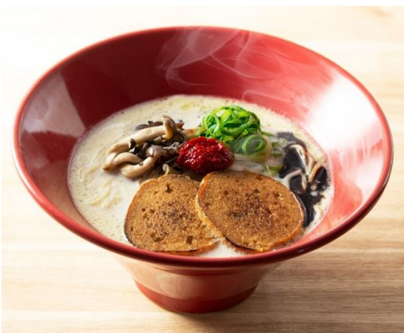
【店舗限定】プラント赤丸

「プラント赤丸」は、動物性食材を使用せずに一風堂の看板ラーメン「赤丸新味」のような味わいを表現したプラントベースのラーメンです。スープは、コク深い豆乳ベースのスープに昆布だしの旨味を加え、まるでとんこつスープのようなまろやかな味わいに。麺は、一般的につなぎとして使用される卵を使わずに、博多らしい細麺に仕上げました。トッピングの主役は、しっかりとした歯ごたえとボリューム感のあるベジチャーシュー。さらに、香りと食感のアクセントにオリーブオイルで炒めた3種のきのこをトッピングします。ガーリックが効いた香油と特製の辛みそを少しずつスープに溶かしていくのがおすすめの食べ方です。国内では「浅草雷門通り店」の他にも「銀座店」「銀座東店」「原宿竹下通り店」「四条烏丸店」「金沢香林坊店」でレギュラーメニューとして販売しています(2025年1月時点)。