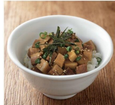
チャーシューまぶしごはん