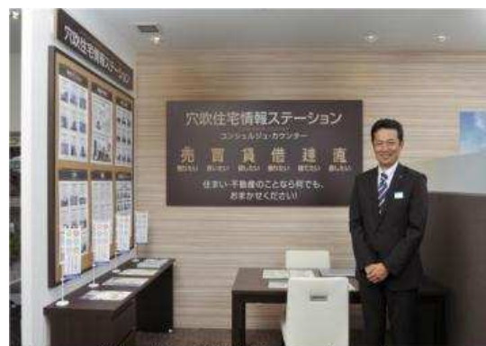
新サービス『住宅情報ステーション』 コンシェルジュ・カウンター