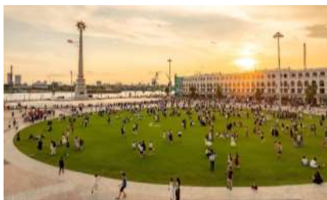
【当社参画街区に隣接する広場 (ロイヤルスクエア) 竣工写真】