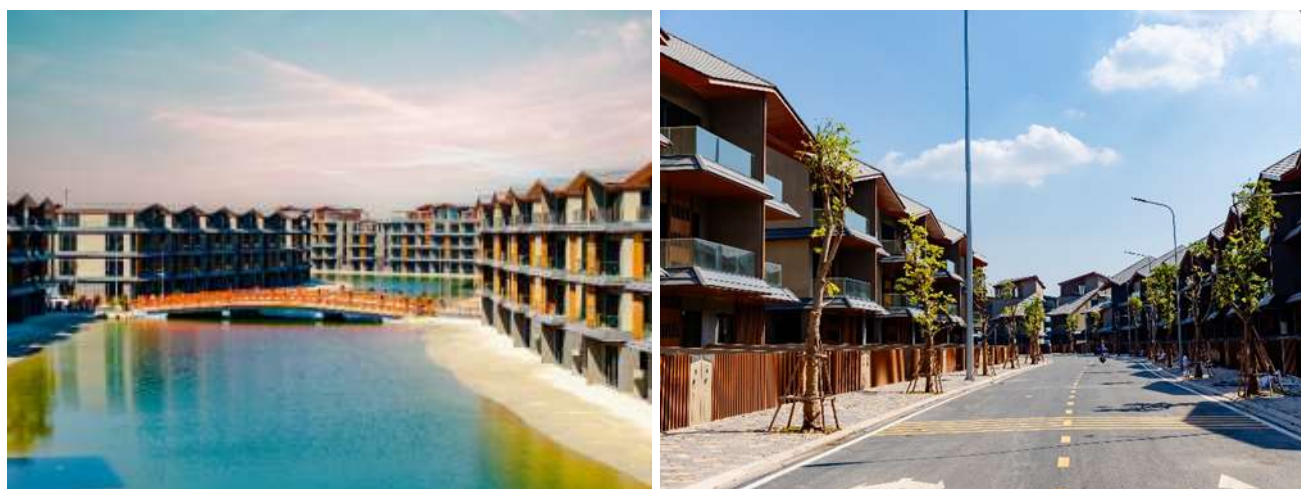
【既参画街区 竣工写真】

ベトナムにおける大規模タウンシップ開発では、街区ごとに異なる特徴を持たせることで特色のある街づくりを行うことが一般的ですが、日系パートナー企業との参画により、既参画街区での建設現場における品質改善、および日本らしさを感じられる特徴的なデザインを提供することで本タウンシップの価値向上に貢献しております。一例として、世界的に著名な建築家である隈研吾氏を起用し、従来のベトナムの住宅・街並みとは異なる新たな商品設計を実現しました。販売価格が約 1~3 億円/戸と高額でありながらも販売は順調で、2024 年 11 月以降順次竣工・引渡を開始しています。新参画街区においても同様に、品質改善や特徴的なデザイン等により、新たな価値を提供していくことをめざします。