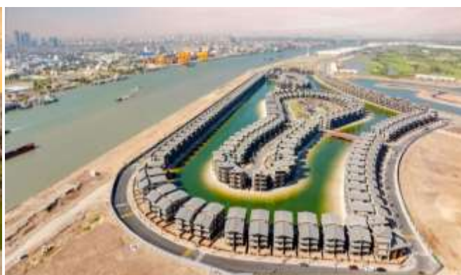
【既参画街区内の中央街区 竣工写真】