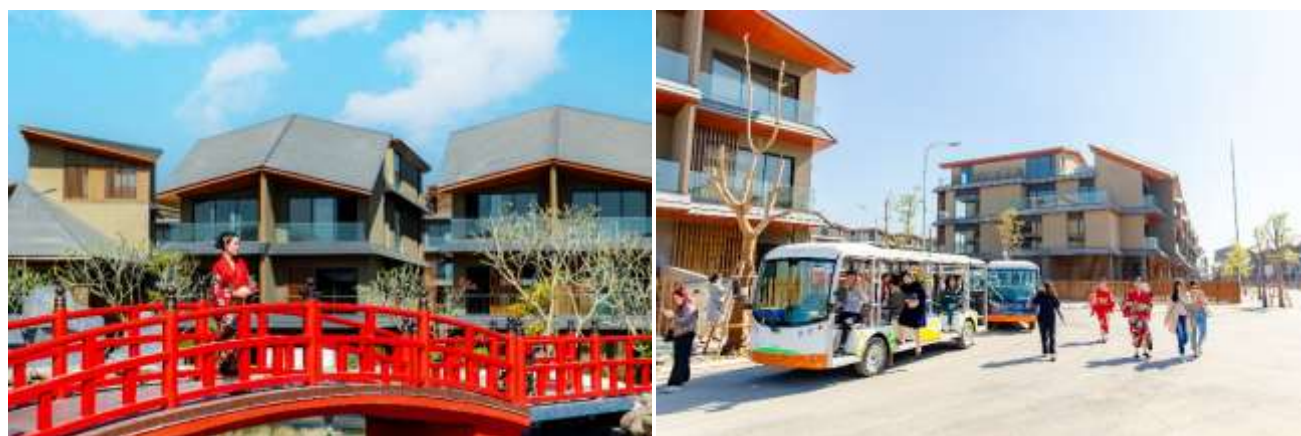
【既参画街区 引渡イベント写真】