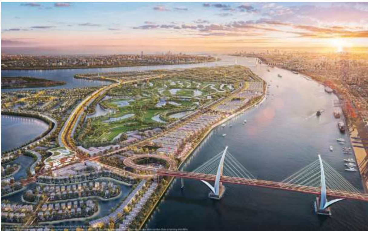
【本タウンシップ「Royal Island プロジェクト」完成予想パース】

この度、幹事企業である野村不動産株式会社および他の日系パートナー企業とともに、本タウンシップ内の新街区に参画することを決定しましたのでお知らせします。今回の追加参画により、本タウンシップ内の合計約 8,300 戸のうち、約 3,000 戸の開発を、当社と日系パートナー企業各社が担うこととなります。