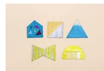
<フローチイメージ>

24日(土)は古紙にマスキングテープや絵具などをペイントしてつくるオリジナルフローチづくり、25日(日)はカラフルな毛糸やこだわりのヒモを使ったハンギングプランターづくりのワークショップを開催します。