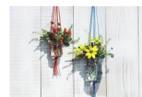
<ハンギングプランターイメージ>