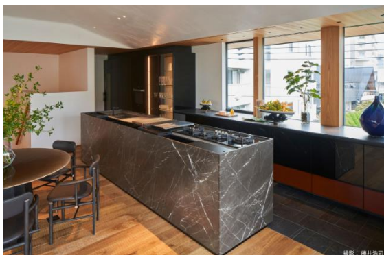
匠の技術が結集したAQレジデンス展示場キッチン

2011年に発生した東日本大震災では、全国から多くの職人が集まり、仮設住宅の建設や支援物資の配送などを実施。また、高級邸宅ブランド「AQレジデンス」の展示場は、日本を代表する伝統工芸の匠の技術が結集して誕生したものです。2020年からスタートした「地球の森守りプロジェクト※1」では、匠の技による芸術的価値を伝え、ものづくりの楽しさや喜び、地球環境について考える場を提供。ワークショップや環境貢献グッズの製作を実践しました。