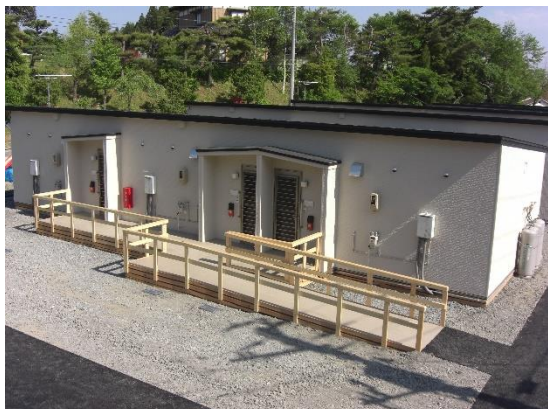
東日本大震災時に建設した応急仮設住宅