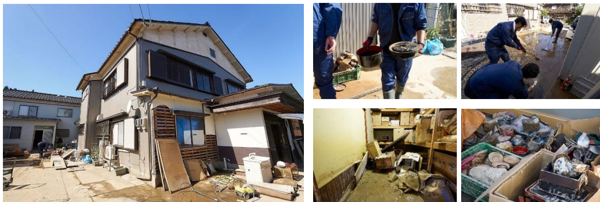
塗師屋いち松工房再建支援の様子

輪島塗職人「塗師屋いち松」と弊社は、震災前から深い関わりがありました。新築引き渡しの際には「塗師屋いち松」の輪島塗お椀を贈呈しており、多くのお施主様から感謝のお言葉をいただきました。また、弊社が手掛ける高級邸宅ブランド「AQレジデンス」新宿展示場の洗面台、駒沢展示場のキッチンボードは「塗師屋いち松」による輪島塗の装飾。「地球の森守りプロジェクト」にもご参画いただいております。