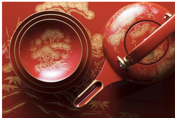
日本が誇る輪島塗「塗師屋いち松」の作品

昨今、日本では大地震が頻発しています。特に来年2025年1月は能登半島地震から1年、阪神淡路大震災から30年の節目を迎えます。災害に対する備えについて考える1年になるでしょう。創業以来、AQ Groupも様々な災害を経験し、あらゆる活動を展開してきました。そこで「災害時、本当に重要なのは地域を超えた連携である」との気付きを得て、相互扶助の活動を推進しています。