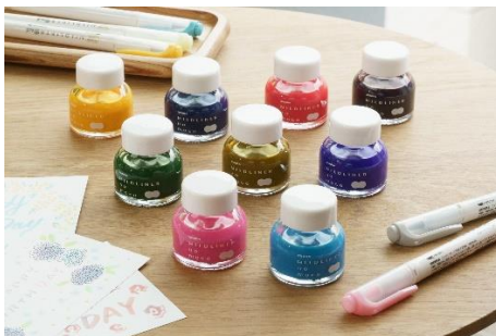
△マイルドライナーのもと全9色