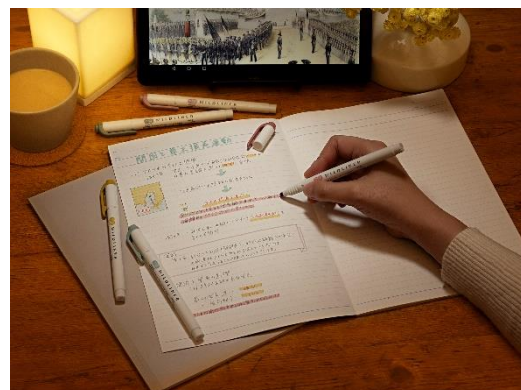
頑張りすぎない気持ちに寄り添う色合い