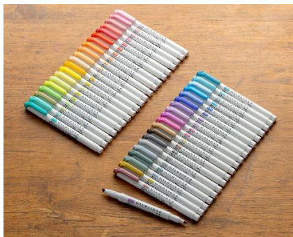
△マイルドライナー全40色

※ゼブラ調べによる「#マイルドライナー」と「#mildliner」の検索結果の合計数（2024年12月現在）