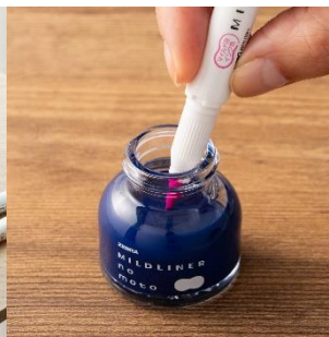
△インクを直接つけてグラデーションを表現できる