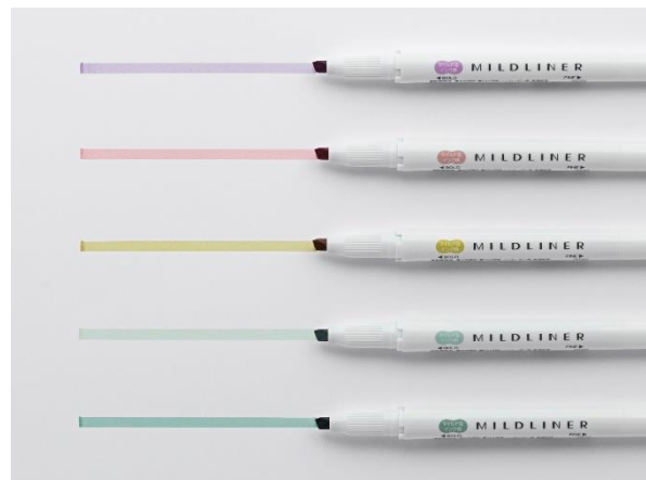
心落ち着くグレイッシュな色味の新色

*** この商品に関する報道関係の方のお問い合わせ先 *** ゼブラホールディングス株式会社 プロダクト&マーケティング部 PRチーム：池田・鈴木 TEL:050-1706-0335 e-mail: tiked@zebra.co.jp / ysuzuki@zebra.co.jp *** この商品に関する消費者の方のお問い合わせ先 *** ゼブラ株式会社 お客様相談室 TEL:0120-555335(平日9時~17時) https://www.zebra.co.jp/