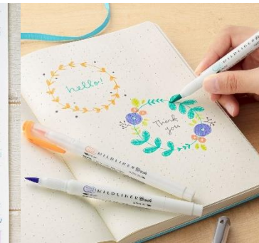
△マイルドライナーブラッシュ