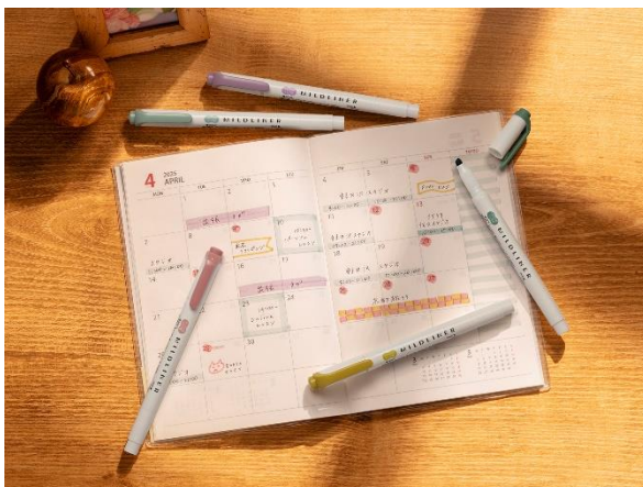
落ち着いた気持ちで勉強や仕事、趣味に使うシーンに

今回発売する5色は、生活の中でゆっくりとした時間を過ごす時の気持ちをインクの色として表現しました。マイルドライナーが持つおだやかな色合いはそのままに、心落ち着くグレイッシュな色味にこだわりました。