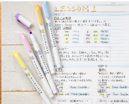
△トーンがまとまる勉強ノートに