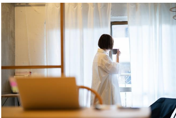
若い人に広がるチルという価値観

文具も、近年優しい色合いのインクや落ち着いたトーンのボディカラーのものが人気です。 このマイルドライナーの新色は、勉強や仕事に取り組みながらも「頑張りすぎない気持ち」に寄り添うための色合いになるよう意識しました。