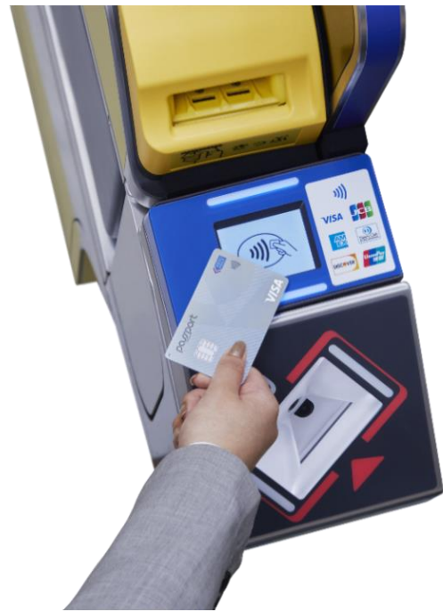
《タッチ決済乗車イメージ》