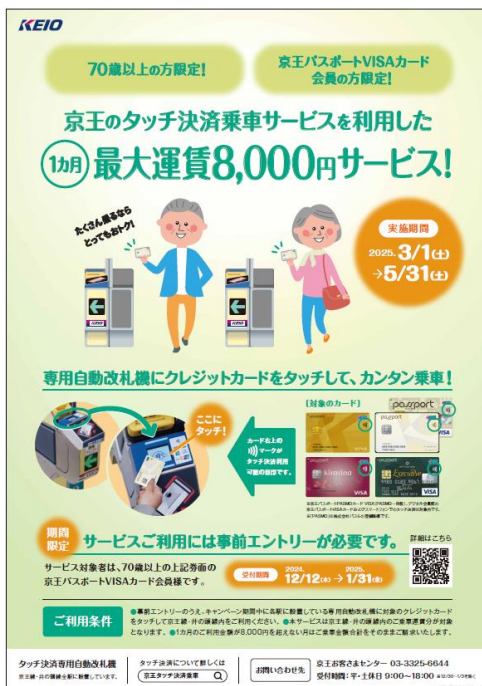
《告知ポスターイメージ》

京王電鉄株式会社（本社：東京都多摩市、取締役社長：都村 智史）は、70歳以上の京王パスポートVISAカード会員様を対象とし、京王線・井の頭線全線の1カ月のタッチ決済乗車サービスご利用金額合計を8,000円（税込み）とするキャンペーンを期間限定（事前エントリー制）で実施します。それに伴い、事前エントリーを12月12日（木）から開始します。