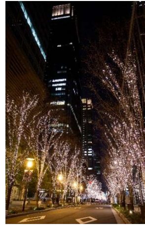
※昨年開催時の様子

場 所： 東京駅前周辺及び丸の内仲通り 期 間： 2024年11月14日(木)～2025年2月16日(日) 計95日間 (予定) 点灯時間： 16:00～23:00 ※12月1日(日)～31日(火)は16:00～24:00 (予定) ※一部エリアにより異なる場合あり W E B： https://www.marunouchi.com/pickup/event/4830/