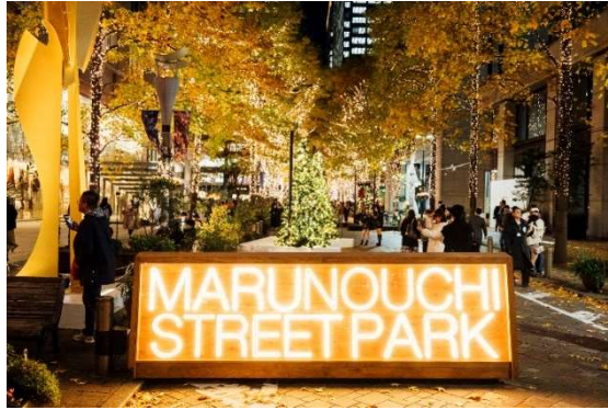
※昨年開催時の様子

今年の「丸の内仲通り」は約500mにわたり、本場のクリスマス感をより一層味わえるクリスマスマーケットやキッチンカーが登場です。この時期限定のあたたかいメニューもあるため、イルミネーションと合わせて寄り道するにはもってこい！また「行幸通り」ではスケートリンクも開催しておりますので、ぜひ東京・丸の内ですべて特別な思い出となるひと時をお過ごしください。