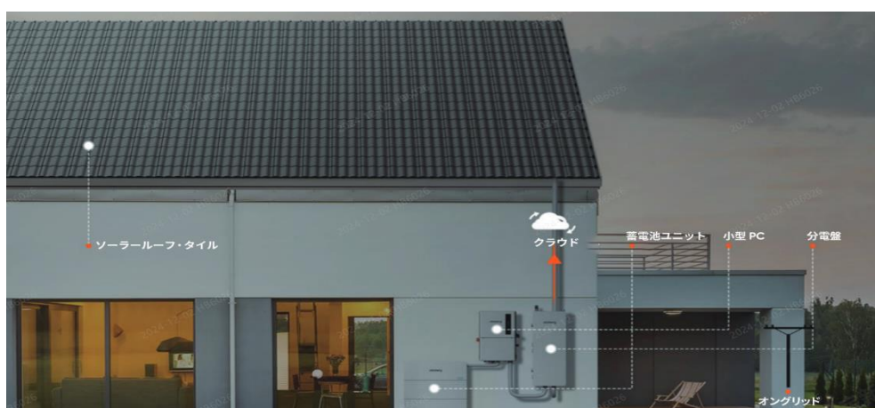
Jackery SolarSaga Barrel Tile 使用イメージ

伝統的な瓦屋根を再現し、美しさと機能性を兼ね備えた「Jackery SolarSaga Barrel Tile」は、量産前にも関わらず、国際的なデザイン賞「グッドデザイン賞」の受賞や多数の建築事業者からお問い合わせを頂くなど、多方面から高い評価を得ています。今後、一戸建て住居や公園施設のほか、寺社仏閣をはじめ伝統的な建築物などへの導入を目指しています。