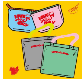
メッシュポーチ & メッシュトート

URL： https://www.keikyu.co.jp/cp/sento2024/