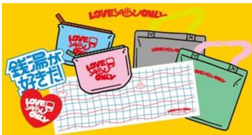
オリジナルグッズイメージ