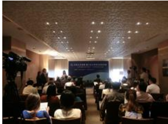
台湾におけるインバウンド事業開始の記者発表会 2014年6月開催