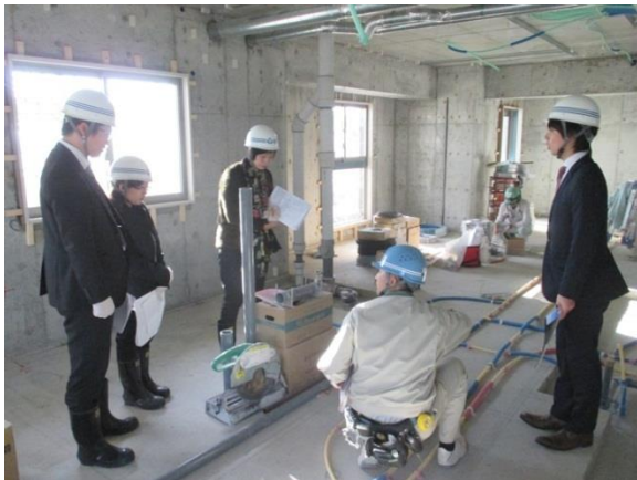
日本で研修を受ける香港現地スタッフ