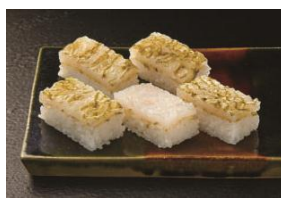
【堺捨(さかすて)】 実演 白えび押し寿し