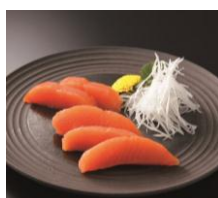
【鮭乃丸亀】 さしみ鮭さく造り