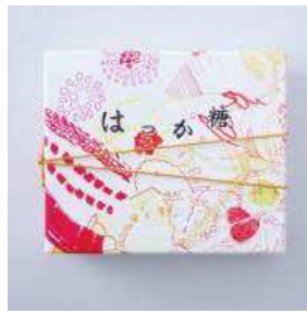
「はっか糖 箱」 450 円(税込)

新潟県妻有地方で唄い継がれる、稲作豊穰を祈願する祝い唄が由来。越後の酒米を魚沼山系の伏流水で仕込んだ味は、新潟では数少ない甘口のお酒です。女性でも手軽に飲みきれぬワンカップサイズ。贈り物にもお勧めです。