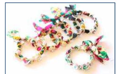
ワークショップでの 製作アクセサリイメージ