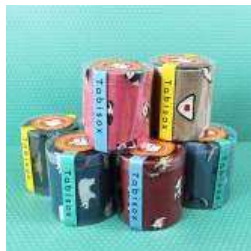
「Tabi sox」 1,080円(税込)

「日本のおみやげをもらい上げよう!」を合言葉に立ち上がった新ブランド「にっぽん CHACHACHA」には、日本各地に散らばったたくさんのステキ!がいっぱいです。あげる人も貰った人もわくわく楽しい気持ちになれる。そんな日本のおみやげを提案いたします。