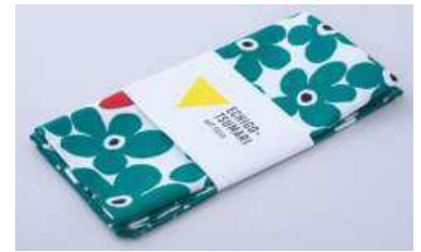
「ふろしき キョロロ(緑)」

明治創業の十日町の伝統銘菓。その清々しい甘さは、エスプレッソコーヒーとの相性が抜群です。ウエハースを着物に見立てた、ちょっとおしゃれなはっか糖を、繊細でやわらかな線画のかわいらしい箱に詰めました。