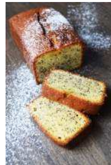
「高ヶ坂しっとりパウンド」 980 円(税込) アールグレイの風味豊かな重量感のあるしっとりとしたパウンドケーキです。