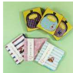
<上> 「にっぽん旅がま口」 1,512円(税込) <下> 「にっぽん旅ハンカチ」 648円(税込)