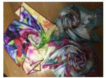
「横浜スカーフ」 5,400 円(税込) 横浜の街並みを描いたデザインのスカーフ。