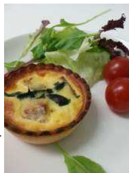
「サクサクモリーくん(サーモンとわかめ)」 500 円(税込) 具材には三陸のサーモンとわかめを、そしてソースには地元の酒蔵から特別に入手した酒粕と、地元の味噌をかくし味に使用し、新鮮な海の幸に合う、まろやかなコクを出しました。炭火でサクサクに焼き上げたキッシュです。