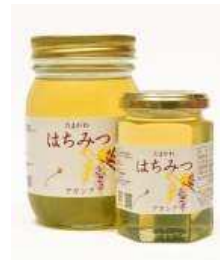
「たまがわはちみつ アカシア」 <右>1,250 円(税込)/180g <左>3,200 円(税込)/500g 玉川大学ミツバチ科学研究センターの監修による国産のはちみつです。