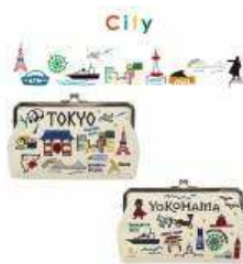
「City がま口」 3,132円(税込)