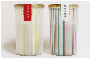
(右)「天神囃子 特別本醸造 180ml」