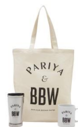
<PARIYA & BBW>