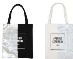
<オープニングセレモニー>