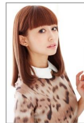
5/3・5/4 出店 <木野園子>