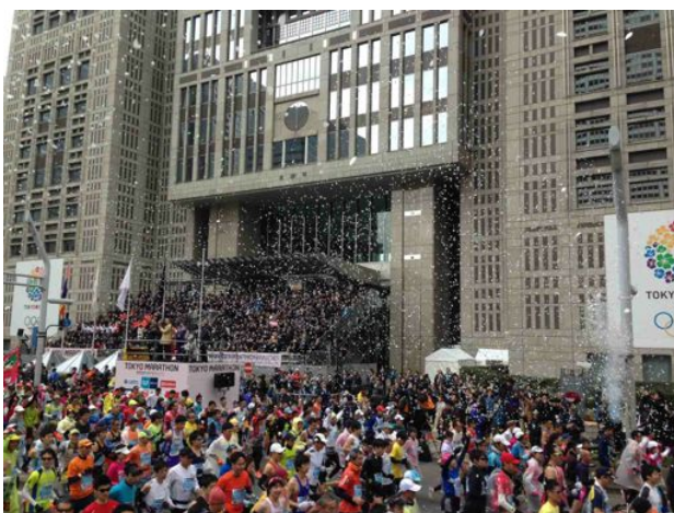
<東京マラソン 2014 当日の様子>

マニフレックスは 2 月 23 日開催「東京マラソン 2014」のオフィシャル・スポンサーです。