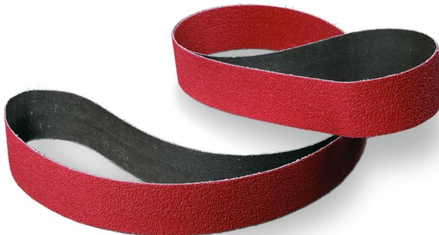
3M™ レジンボンドクロスベルト 984F