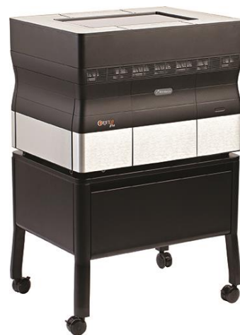
写真上：複数マテリアル対応デスクトップ 3D プリンター「Objet30 Pro」

本サービスでは、高解像度 3D プリンター「Objet30 Pro」を、月額 10 万円の特別価格で最大 6 カ月間のレンタルにてご提供します。本体のみならず 3D プリンターを稼働させるために必要な周辺機器や材料も含まれており、お客さまにとって導入前に 3D プリンターの機能と利点を検証いただくことができます。また、検証後に引き続きご利用を希望される場合は、継続プランとして長期レンタル（期間 26 カ月、もしくは 36 カ月）でのご提供が可能です。